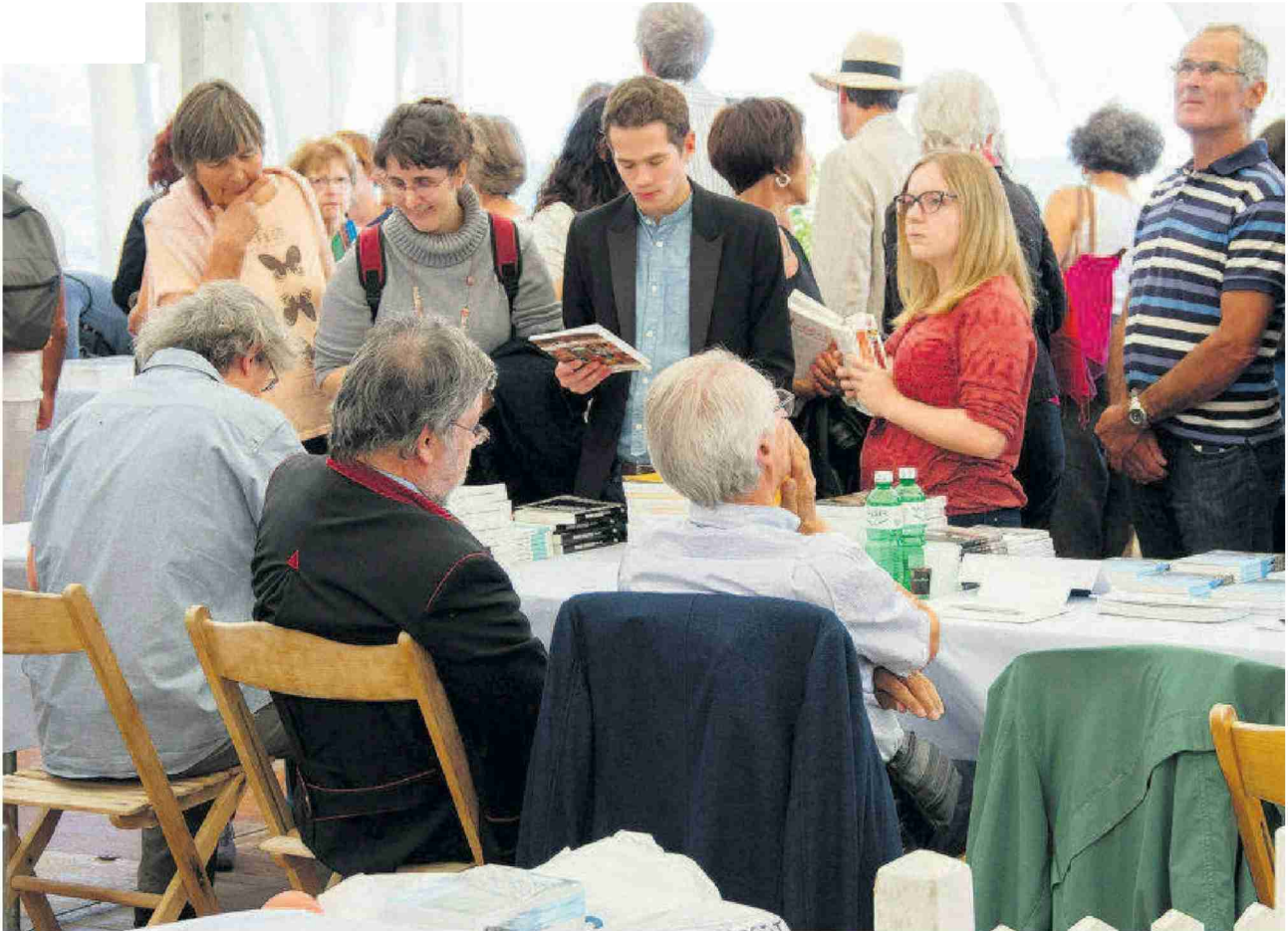
La manifestation a attiré un large public venu découvrir les écrivains célèbres, mais aussi des thèmes plus pointus comme cette année la Grèce moderne. Favre

N° de thème: 840.007 N° d'abonnement: 1096729 Page: 6 Surface: 127'025 mm 2