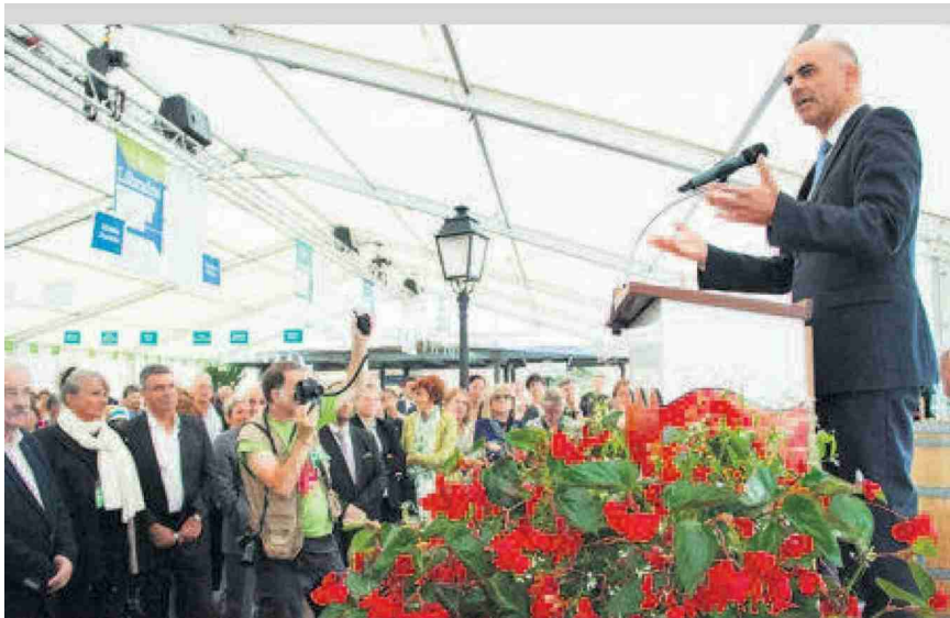
Le conseiller fédéral Alain Berset était de la partie.

N° de thème: 840.007 N° d'abonnement: 1096729 Page: 6 Surface: 127'025 mm 2