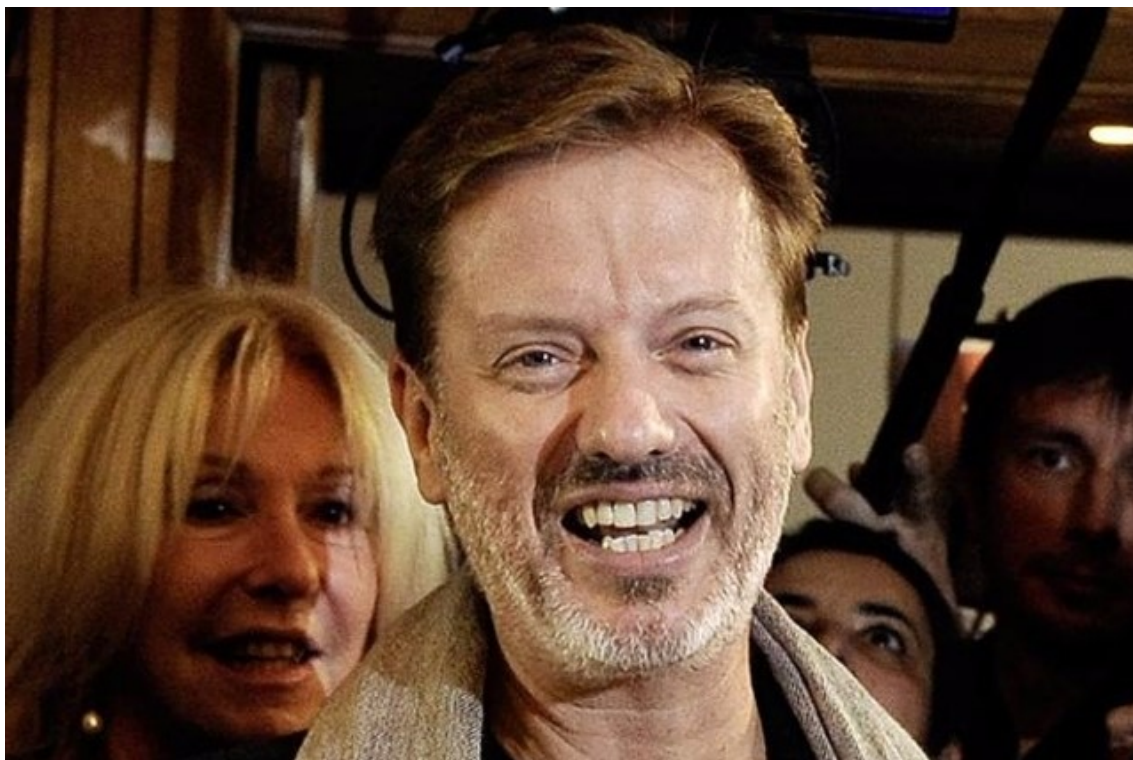
Alexis Jenni.

Critique Avec «Dans l'attente de toi», le lauréat du Prix Goncourt 2011 décrypte les tableaux pour mieux célébrer la beauté de sa muse.