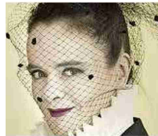
Amélie Nothomb.