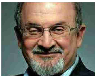
Salman Rushdie.