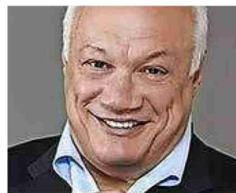
Eric-Emmanuel Schmitt.