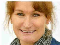
Viveca Sten.