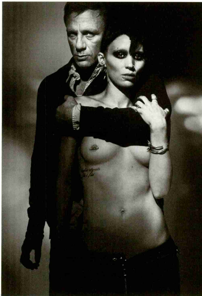
Daniel Craig et Rooney Mara dans «Millénium», adapté par l'Américain David Fincher.

Le Livre sur les quais met à l'honneur les auteurs nordiques